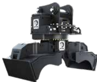
RPA PARA COMPACTACIÓN DE BASURA