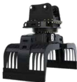
RPA PARA BASURA