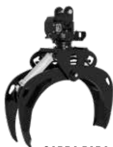
GARRA PARA TRONCOS