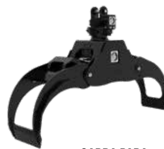
GARRA PARA AGRUPAMIENTO